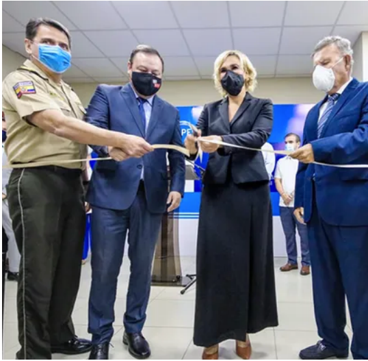
Fuente: Inauguración de centro operativo local ECU 911 - Ecuador221

Nacional, el Ministerio de Salud Pública y el Comando Operacional n.o 2.