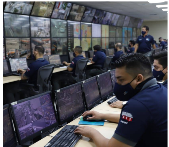
Funcionarios de CSCG en operación

Las soluciones ofrecidas por BYNE en colaboración con Hexagon ofrecen herramientas de última generación que aumentan la eficiencia de la gestión de incidentes y el monitoreo de grandes eventos.